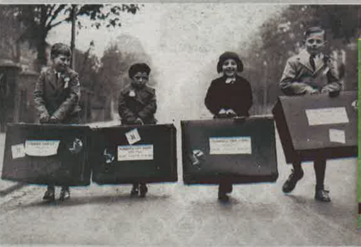
▼ Migración infantil.