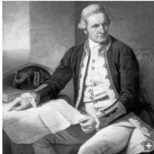
Retrato de James Cook, descubridor de las actuales tierras australianas en 1770 (Nathaniel Dance-Holland, 1776).